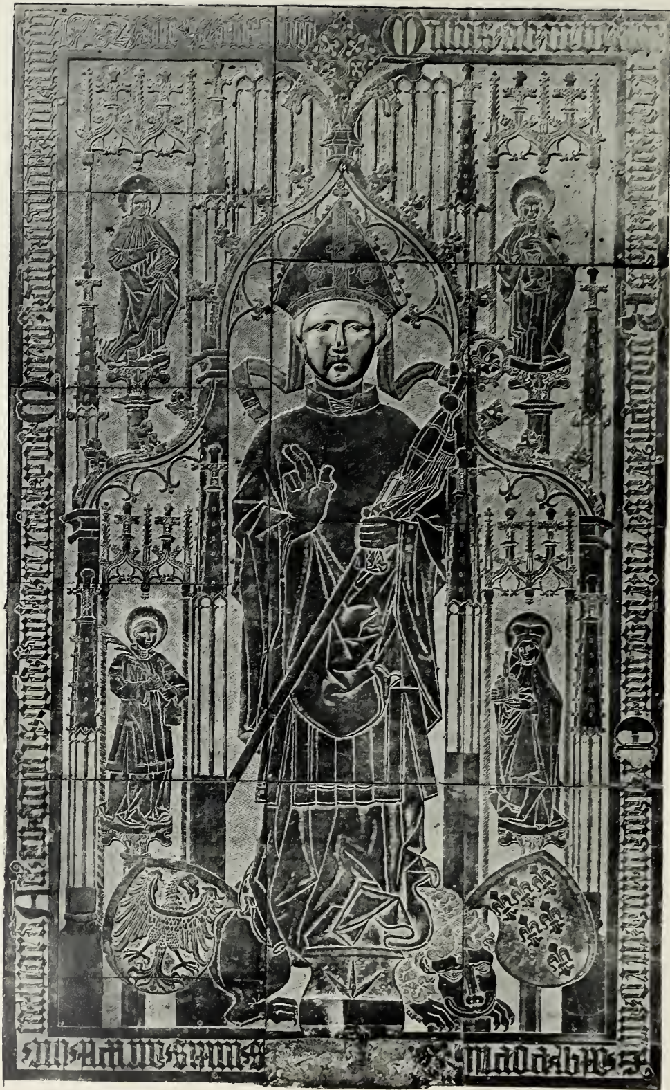
Rudolf von Rudesheim.